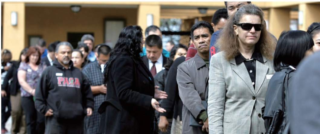
金融危机造成美国经济巨大损失，失业率至今高企

由于绿色就业是一个富有争议的话题，对绿色就业持质疑、批评乃至激烈反对态度的一直存在并且不在少数。例如，传统基金会反对绿色就业的提法，反对奥巴马对绿色就业的政策支持。